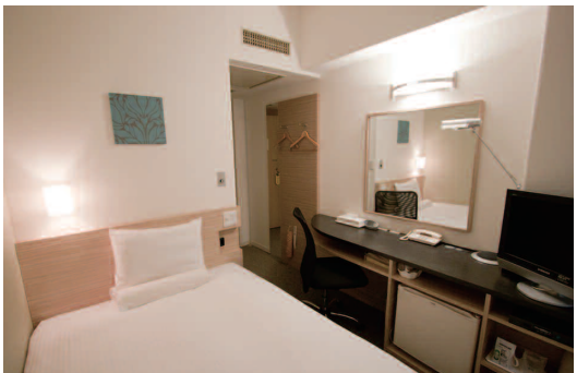
シングルルーム。全室に高速インターネット接続サービス(LANケーブル)、消臭剤、曇り止め鏡、加湿器、空気清浄機を完備