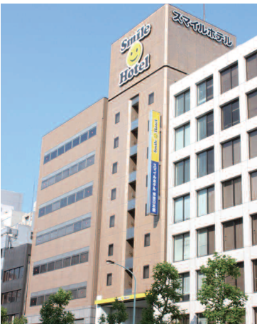
スマイルホテル外観。周辺にコンビニエンスストア、銀行、ドラッグストア、カフェなどがある。スマイルホテルのフラッグシップ店舗とするためリニューアル