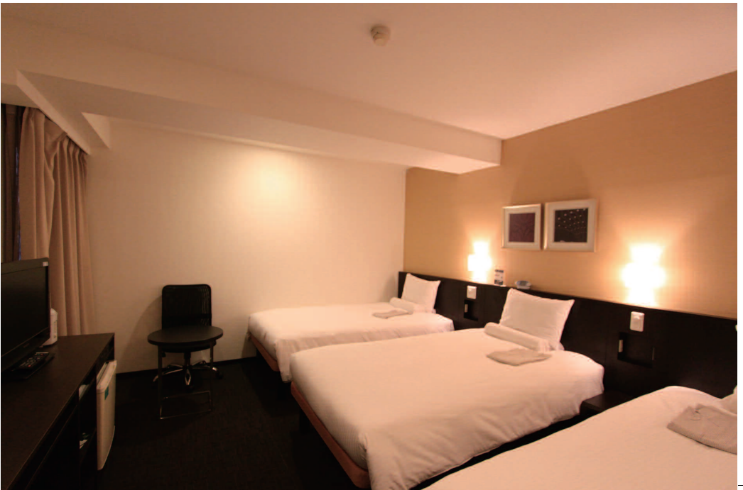
時代のニーズに合わせて、より機能的に快適に過ごせるようリニューアルしたトリプルルーム